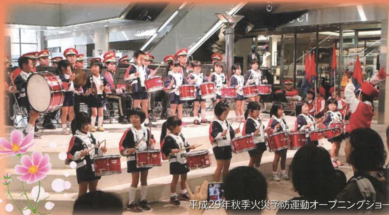
平成29年秋季火災予防運動オープニングショー