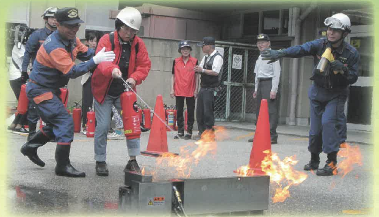
消火体験装置「Kesuzo」消火訓練の様子