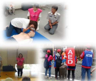
(例 防災訓練 金沢マラソン など)