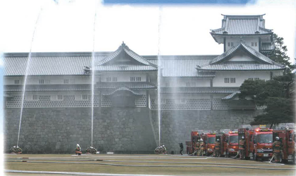
金沢城公園での火災防御訓練の様子