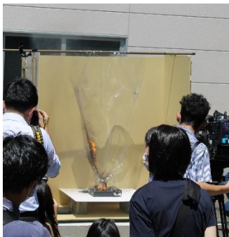
【コンロ火により燃焼】